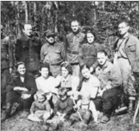
מחנה משפחתי, שכלל נשים וילדים

גם קבוצות פרטיזנים אחרות כללו נשים וילדים, ואנשים שלא היו מסוגלים להילחם, אך נמצאו להם תפקידים חיוניים לקבוצה כמו: בעלי מלאכה, חייטים, טבחים, רופאים ועוד.