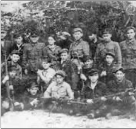
יחידת הפרטיזנים של האחים ביילסקי

גם קבוצות פרטיזנים אחרות כללו נשים וילדים, ואנשים שלא היו מסוגלים להילחם, אך נמצאו להם תפקידים חיוניים לקבוצה כמו: בעלי מלאכה, חייטים, טבחים, רופאים ועוד.