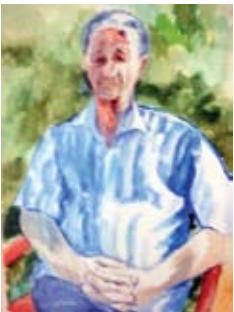
הסופר יזהר סמילנסקי

בחיוך משובב לב החלה נעמי לספר לנו פרטים על מקורות חייה העשירים: