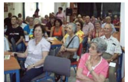
פעילות בקפה תרבות על"ה

הורחבו סמכויות ועדת הביקורת. האספה הכללית עידכנה את תקנון העמותה לגבי השם החדש של העמותה, והגדילה מספר חברי המזכירות מ-3 ל-9 חברים.